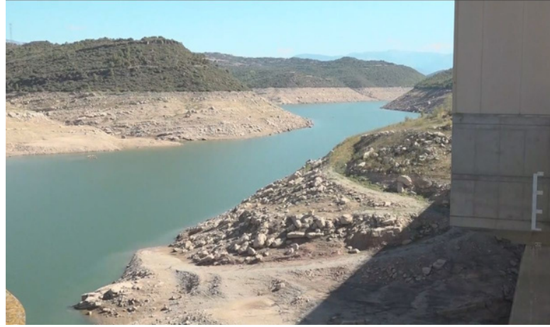
El pantà de Rialb ha arribat enguany a nivells extrems per causa de la sequera.

Cal recordar a la població que com ha informat l'Ajuntament, no la utilitzi per consum habitual, ja que no disposa dels paràmetres òptims marcats per la normativa. Sembla que aquest capítol de sequera s'allargarà uns mesos més, a no ser que hi hagi una tardor i un hivern molt plujós, però les prediccions de moment mostren el contrari.